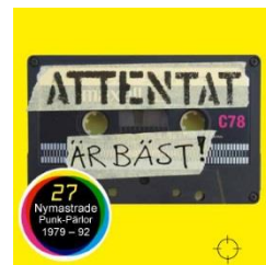
Smash hits 78-92 (CD)