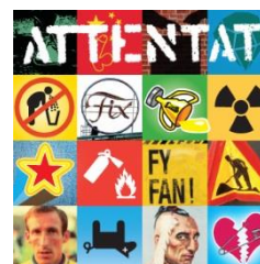
Album 2013 (CD, Vinyl)