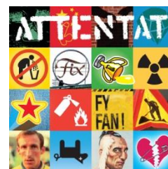
Album 2013 (CD, Vinyl)